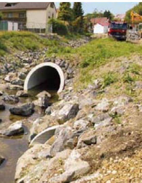
Bad Schussenried, Bachlauf