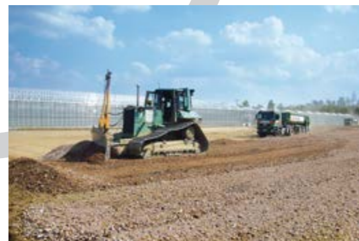
6. Verwendung güteüberwachter Recycling-Baustoffe