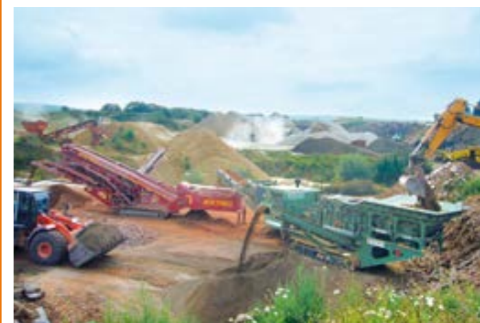
5. Herstellung güteüberwachter Recycling-Baustoffe