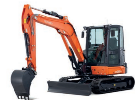
MINIBAGGER 3 BIS 6 T inkl. Löffelpaket