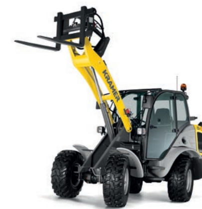
RADLADER 3 BIS 8 T inkl. Schaufel und Palettengabel