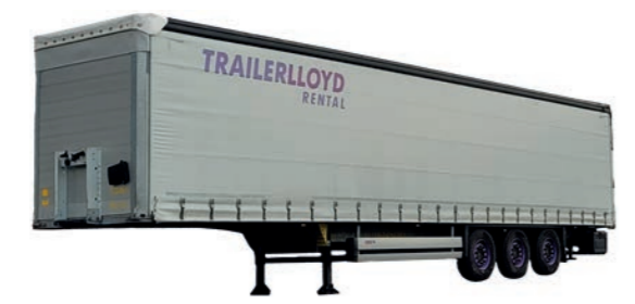
PLANENAUFLEGER 3-Achs-Sattelaufleger mit seitlicher Schiebeplane