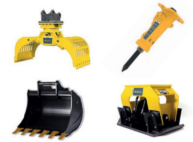
ANBAUGERÄTE Verschiedene Löffel, Sortiergreifer, Hydraulikhammer, Anbauüttelplatten, etc.