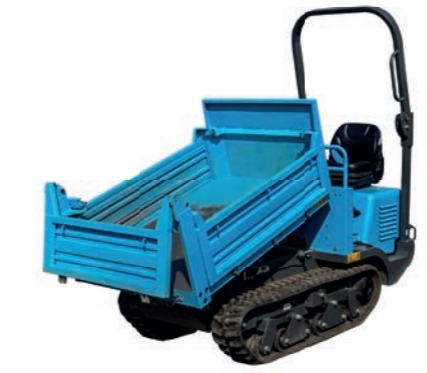
MINI-RAUPENDUMPER 1,5 T