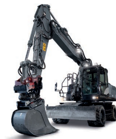
RADBAGGER 16 BIS 20 T