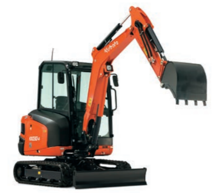
MINIBAGGER 1 BIS 3 T inkl. Löffelpaket