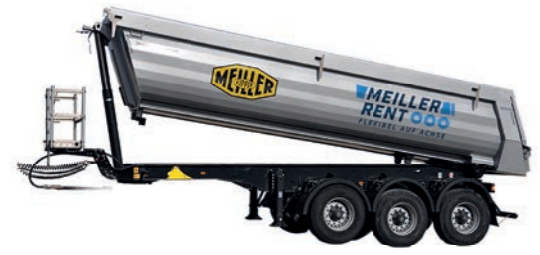
KIPPSATTEL MIT STAHELMULDE 2 oder 3-Achs-Kippsattelanhänger mit einem Nennvolumen von 25m 3