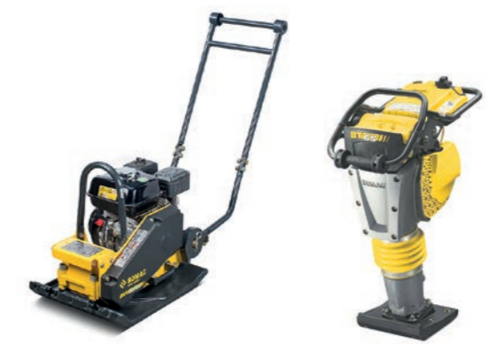
KLEINGERÄTE Rüttelplatten, Vibrationsstampfer, etc.