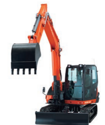
KOMPAKTBAGGER 6 BIS 8 T inkl. Löffelpaket