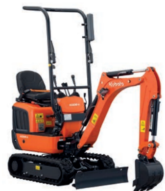
MINIBAGGER BIS 1 T inkl. Löffelpaket