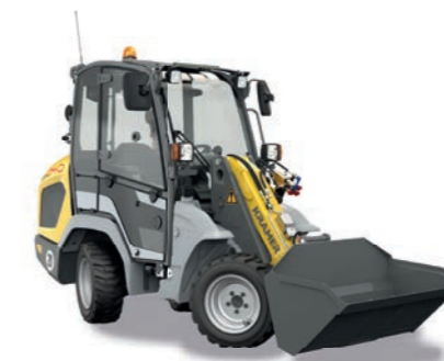
RADLADER BIS 3 T inkl. Schaufel und Palettengabel