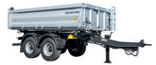
ZENTRALACHSANHÄNGER Nennlast von 13,6 t geeignet für alle Schüttgüter wie Sand, Kies, Aushub